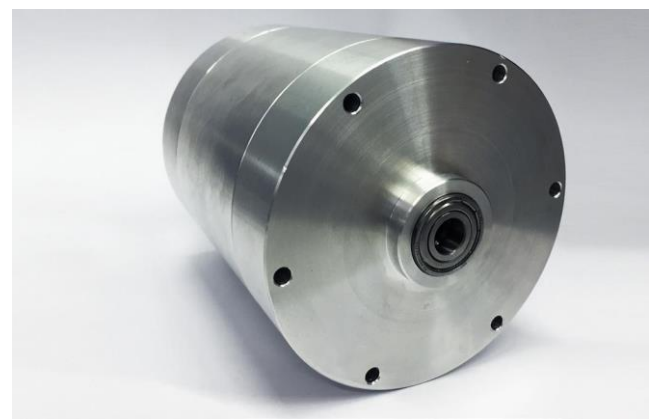
Sensorlos geregelter Synchronmotor ohne Seltenerdmetalle